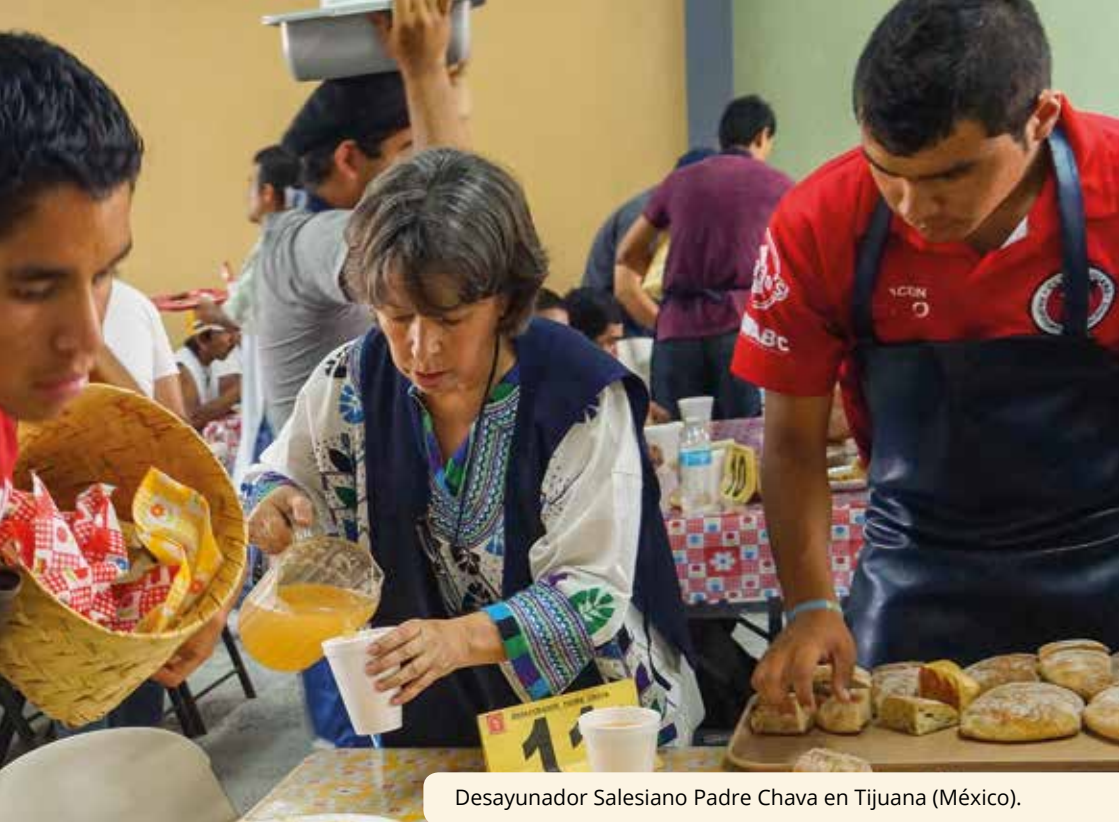
Desayunador Salesiano Padre Chava en Tijuana (México).

llegan irregularmente a países de tránsito o destino, en una situación de gran vulnerabilidad. Tenemos presencias en las rutas migratorias desde países como Cuba, Haití y Centroamérica hacia México, y se podría enumerar una constelación de casas salesianas ubicadas en los suburbios de las grandes ciudades de los cinco continentes para dar respuesta a los jóvenes que están en movimiento, también con la emigración de jóvenes pertenecientes a minorías étnicas. Aquí, además del drama económico, está la crisis de identidad cultural e integración, un fenómeno que existe en varias partes del mundo.