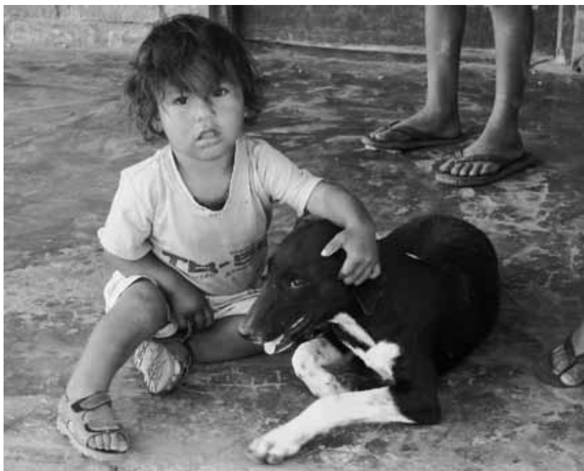
AUTORA: PATRICIA RODRÍGUEZ, MISIONES SALESIANAS

Los niños de la calle son una realidad lo suficientemente grande como para pasarla por alto. Los salesianos se esfuerzan por evitar que pierdan su infancia, por ayudarles a recuperarla. Hoy, las dificultades económicas que golpean al llamado primer mundo amenazan con dejar en el olvido este gran problema. La subsistencia de los hogares de acogida y el trabajo salesiano con estos menores depende en gran medida de las ayudas que particulares y empresas destinan a Misiones Salesianas. En la actualidad, muchos de estos centros sufren un déficit económico que hace peligrar su labor. Tu ayuda es de vital importancia. ■