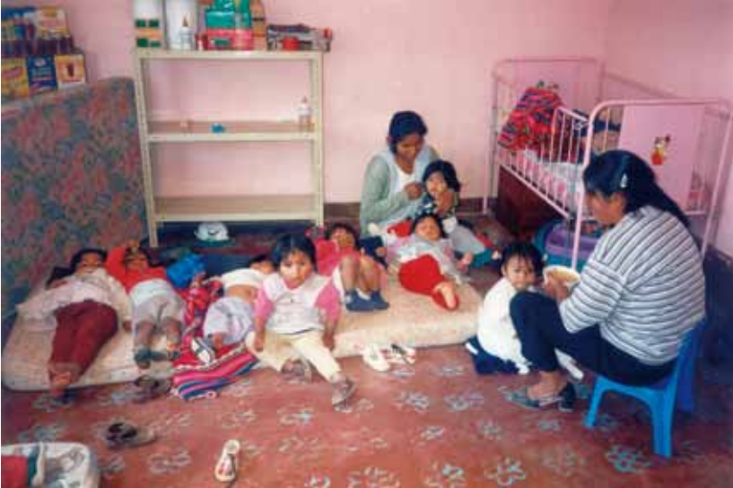
HOGAR DON BOSCO PARA NIÑOS HUÉRFANOS Y ABANDONADOS EN BOLIVIA.