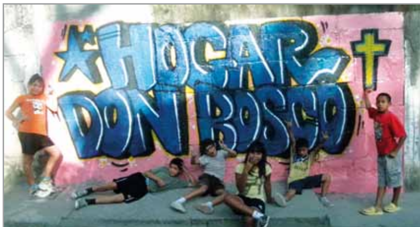
HOGAR DON BOSCO EN HONDURAS.