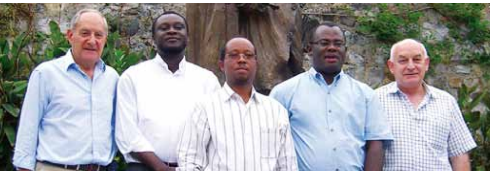
AUTOR: JOAQUÍN SANTIESTEBAN

La educación es la opción fundamental del compromiso salesiano en la reconstrucción de Haití. Siempre, antes y después del terremoto, el proyecto salesiano ha sido un proyecto educativo: Educar evangelizando y evangelizar educando . Los Salesianos tienen en Haití una triple estructura de atención a los niños de la calle -Lakou, Lakay y Timkatek- y en ellos la parte de talleres ocupacionales es básica. Hay también centros específicos de formación profesional: el ENAM y Gressier. ENAM es el centro para magisterio, restauración, las ramas industriales y de la madera; en Gressier se desarrollan las materias agrícolas y de hostelería, sin olvidar la administración... Los centros del norte, Fort Liberté y Cap Haïtien, tienen ramas de salud, agricultura, informática, hostelería y electricidad, con diversos grados. También hay otros dos centros en Les Cayes y Gonaïves. ■