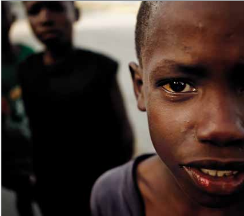
IMAGEN DEL DOCUMENTAL 'HIJOS DE HATÍ' DE MISIONES SALESIANAS.

Nos referimos a aquellos que viven en las calles de una ciudad, privados de atención familiar y de la protección de un adulto. Hoy que los sin techo vuelven a verse más en las calles de nuestro propio país nos es más fácil imaginar el estilo de vida de estos niños en muchos lugares del mundo. Edificios abandonados, estaciones de tren, cajas de cartón o el duro suelo al amparo de los bajos de un coche o un camión son sus dormitorios habituales, rincones donde se sienten relativamente a salvo de agresiones y de la policía. Aun así, nos resulta siempre difícil encontrar una definición precisa que pueda describir la enorme casuística de historias, de circunstancias, de rostros englobados bajo un mismo nombre, "Niños de la calle".