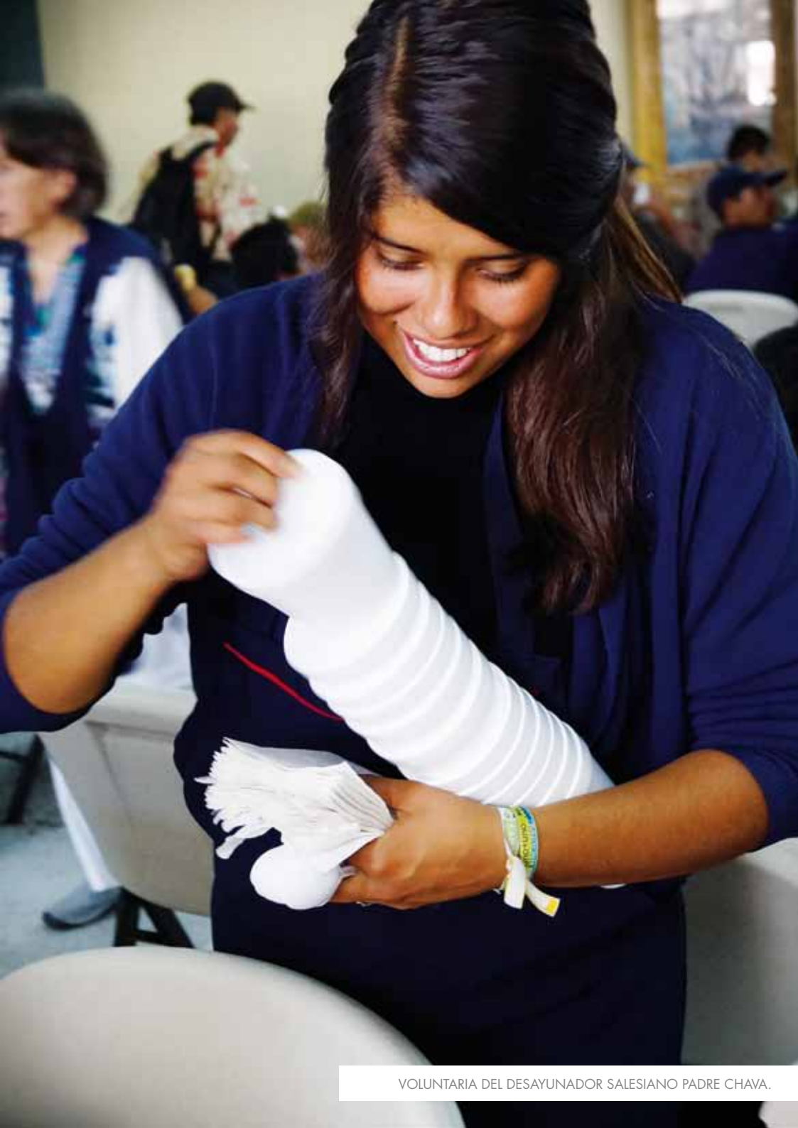
VOLUNTARIA DEL DESAYUNADOR SALESIANO PADRE CHAVA.