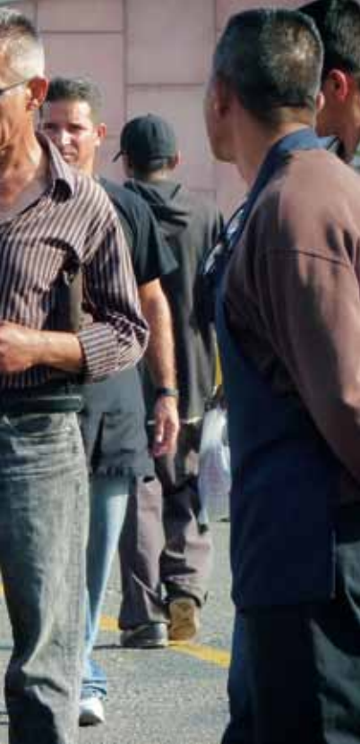
UN VOLUNTARIO DEL DESAYUNADOR PADRE CHAVA ORGANIZANDO LA ENTRADA DE LOS ASISTENTES AL CENTRO.