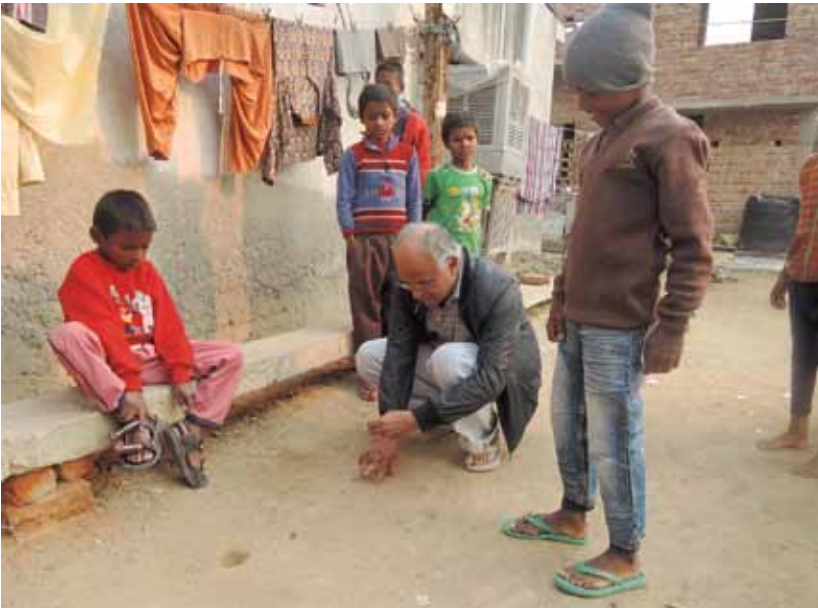
EL P. GEORGE MENAMPARAMPIL. JUEGA A LAS CANICAS CON LOS NIÑOS.

Los misioneros salesianos no queremos que se identifique de ninguna manera a los más vulnerables. Tenemos que ayudar a mantener su dignidad.